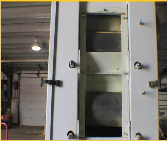
图2. 滚筒粉碎机可用于为饲料原料减小颗粒粒度